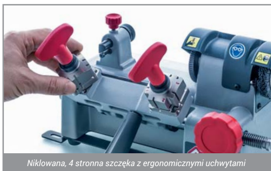
Niklowana, 4 stronna szczęka z ergonomicznymi uchwytami

Blachy mocujące, które są w zestawie, pozwalają na stałe zamocowanie maszyny w punkcie do stołu roboczego. Zapewnia to większą stabilność maszyny. Flash 008 jest dodatkowo lekki i kompaktowy, bardzo łatwy do przenoszenia w transporcie.