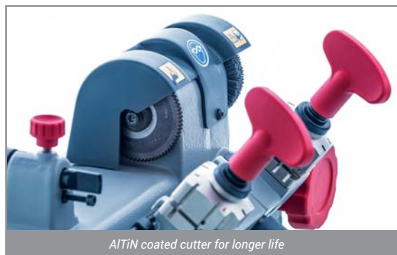
AITiN coated cutter for longer life

Flash 008 wyposażony jest w system regulacji ułatwiający oraz przyspieszający pracę.