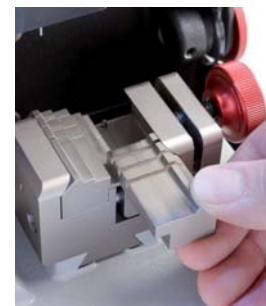
Wymienne szczęki do kluczy laserowych oraz nawiercanych

Futura łączy w sobie znakomity design oraz jakość. Charakteryzuje to nowoczesna linia cięcia, zgrabny kształt maszyny. Urządzenie jest wykonane z wyselekcjonowanych komponentów i materiałów najwyższej jakości. Maszyna stosuje większość najnowszych technologii, spełniające najwyższe standardy jakości Silca.