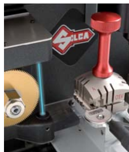
Pryzmatyczny frez i czytnik optyczny dla kluczy płaskich

Silca oraz Expres jest u twojego boku w codziennej pracy.