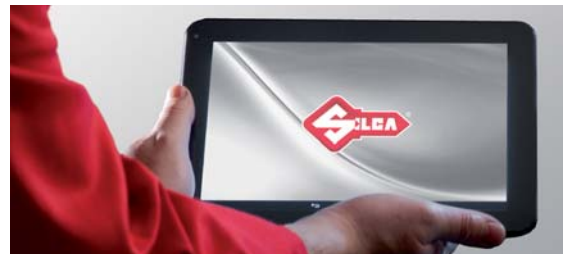
Zintegrowany funkcjonalny tablet z bazą danych Silca

Nasz zespół pomocy technicznej zapewni Ci zdalne wsparcie, gdy tylko będzie to potrzebne. Dedykowana aplikacja do pomocy zdalnej dostępna jest bezpośrednio na urządzeniu**.