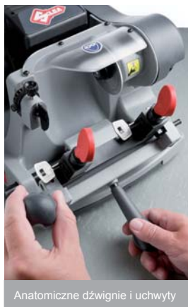
Anatomiczne dźwignie i uchwyty

Obrotowe, 3-stronne szczęki są łatwe do zablokowania z wieloma rodzajami kluczy bez konieczności używania dodatkowych akcesoriów: piórowe, dwupiórowe, pompkowe, z centralną bazą, do skrzynek na listy i klucze specjalne, takie jak: Abloy®, Abus®, Luma®