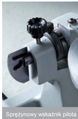
Sprężynowy wskaźnik pilota