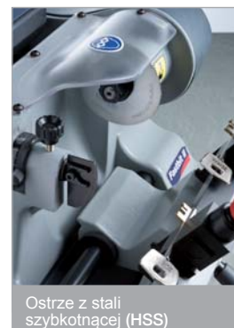
Ostrze z stali szybko tnącej (HSS)

© jest zarejestrowanym znakiem towarowym.