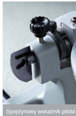
Sprężynowy wskaźnik pilota