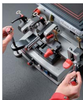
Srebrne chromowane dźwignie

Całkiem nowy, trwały materiał freza z nowatorską powłoką i innowacyjny design, który gwarantuje stabilność podczas nacinania, wózek do pionowego nacinania, oświetlenia LED, rozkładany ogranicznik, ruchome zaciski i wiele innych.