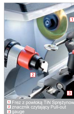
1 Frez z powłoką TiN Sprężynowy 2 znacznik czytający Pull-out 3 gauge

Pojemnik na opiłki został dogodnie zaprojektowany i