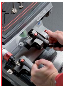
Gładkie ruchy wózka

*również dla kluczy do sejfów z długim trzpieniem