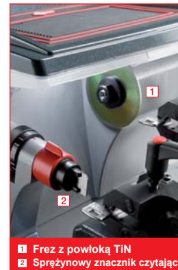
1 Frez z powłoką TiN 2 Sprężynowy znacznik czytający

Zintegrowany obszar na akcesoria w górnej części maszyny jest szczególnie duży i pojemny, dzięki czemu można łatwo umieścić na nim akcesoria i klucze. Pojemnik na opiłki został dogodnie zaprojektowany i usytuowany w ten sposób, aby zapewnić czyste miejsce pracy.