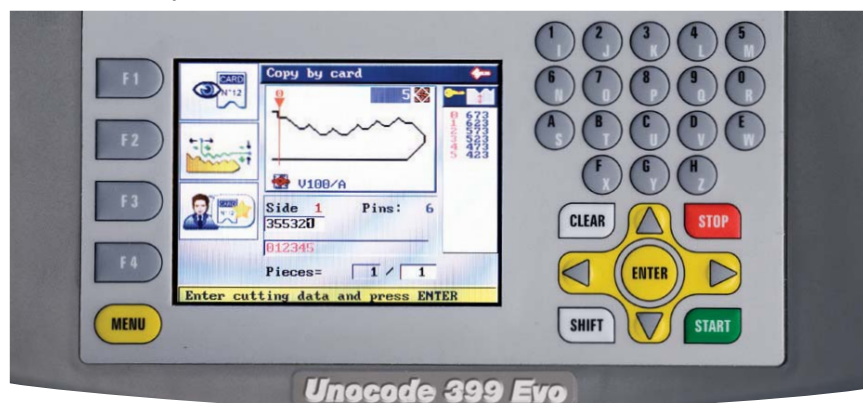
Przyjazna w obsłudze ergonomiczna klawiatura