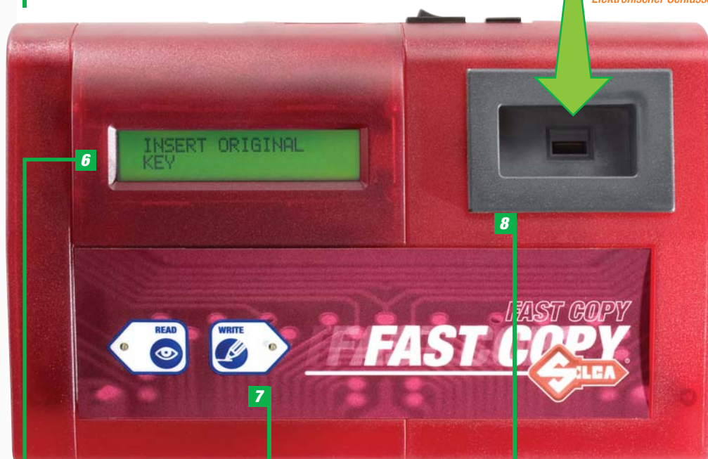
Electronic Keys Główki elektroniczne Elektronischer Schlüssel

6 Display: crystal, retro-illuminated, guarantees excellent visibility.