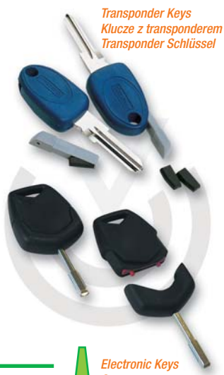
Transponder Keys Klucze z transponderem Transponder Schlüssel

Die Silca elektronische Schlüssel benutzen um die Texas® Transponder mit fixem Code und Crypto zu kopieren.